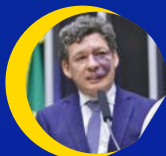
Deputado Federal REGINALDO LOPES (PT-MG)