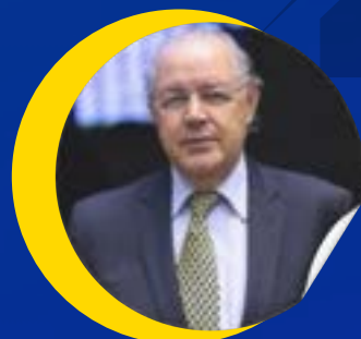
Deputado Federal LUIZ CARLOS HAULY (PODE/PR)